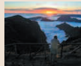
Mar de nubes en el centro de la Isla.

Madeira es una joya incrustada en la soledad del Atlántico. Su estratégica posición hace de sus estaciones climáticas una eterna primavera. Posee muy buenas infraestructuras para el turismo de acción, red de “levadas” (más de 2.000 kilómetros de canales para aprovechar el agua de sus manantiales) con sus correspondientes senderos de mantenimiento que se pueden andar, correr o contemplar. Llegarse hasta Santana y apreciar sus típicos “palheiros” (especie de barraca valenciana), o desde allí ascender al pico Ruivo (el más alto de la isla) submarinismo, etc.