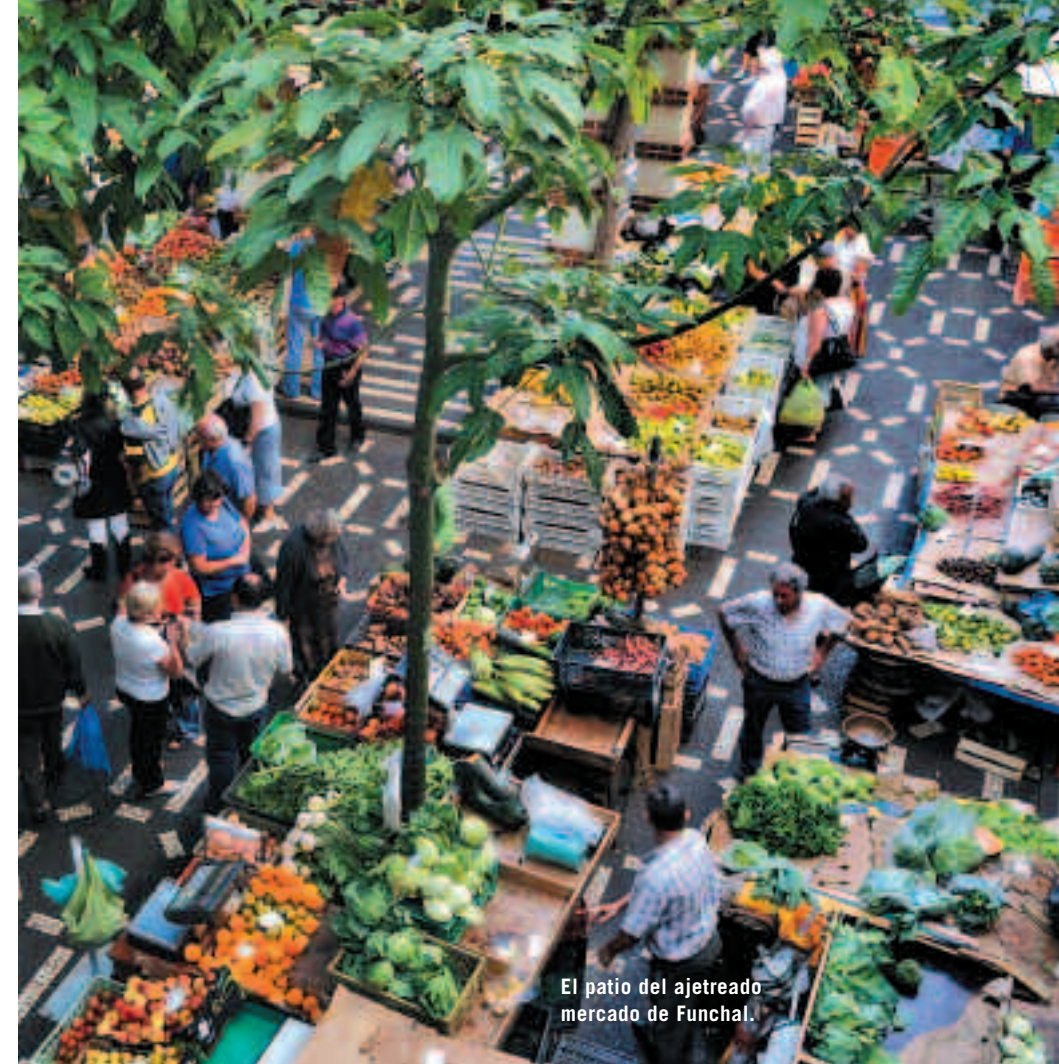
El patio del ajetreado mercado de Funchal.