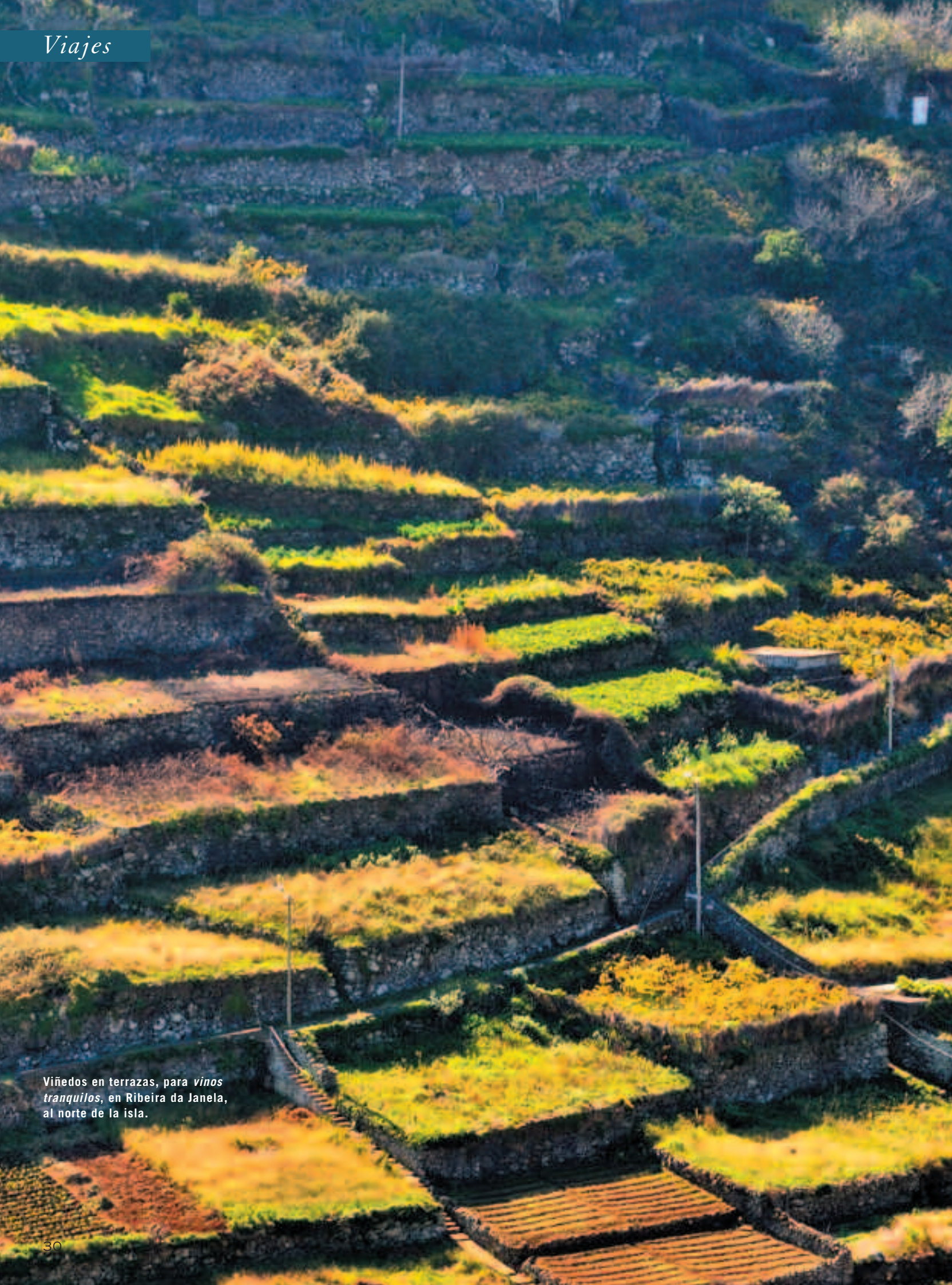
Viñedos en terrazas, para vinos tranquilos, en Ribeira da Janela, al norte de la isla.