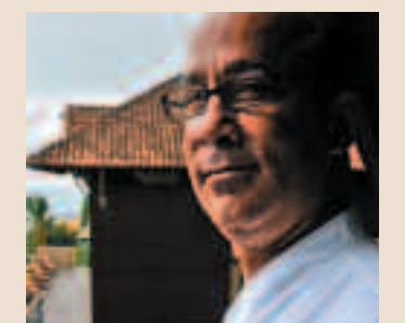
El conocido chef Momo Abbane, del Resort Choupana Hills.

Esplendoroso resort en un estratégico lugar, hotel en un cuidado y amplio jardín, con casitas individuales y toda clase de comodidades, vistas maravillosas. Espectacular Spa. Con el valor añadido de su restaurante Xôpana, cocina dirigida por el famoso Momo Abbane, cocinero canadiense con experiencia adquirida en España, Canadá o Cabo Verde.