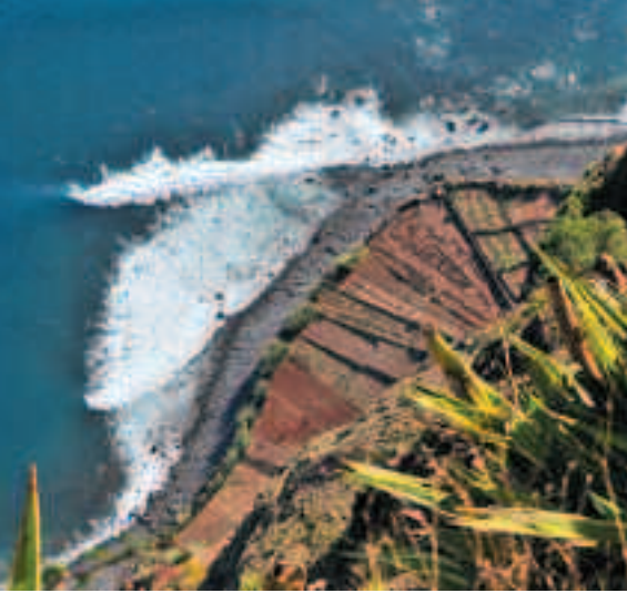
El mirador de Cabo Girão, con casi 600 metros de caída, pone a prueba nuestros nervios.