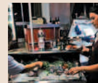
Carro del pescado del Restaurante Churchill, en Câmara de Lobos

Grandes acuarios de pescado y marisco invitan a degustar su especialidad: el mar. Buenas espetadas de marisco, verduras y pescado.