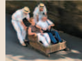
“Carinhos do cesto”: cómo sentirse niños en el pueblo de Monte.

En el pueblo de Monte, justo al lado de la iglesia de Nuestra Señora do Monte (S. XVIII) y del espléndido Jardim do Palácio, se encuentran los famosos “Carinhos do cesto”, conducidos por expertos pilotos “cariñosos” que nos conducirán a buen ritmo por las expeditas y empinadísimas calles del pueblo. 25 Euros cuesta un viaje a la infancia, de apenas dos kilómetros, (barato si ésta se halla muy lejana) sin salir de los deportes de riesgo, a uno siempre le queda la opción de subir al monte en teleférico (o bajar al jardín del Almirante Reis) para temblar con su desnivel de más 500 metros, sus vertiginosas vistas de barrancos, cortadas, el mar y tejados de Funchal.