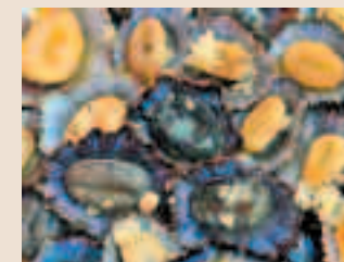
Lapas frescas del Restaurante Orca, de Porto Moniz.

Excelentes pescados recién pescados. Lapas, cherne, espada preta, en un ambiente marinero, terrazas con vistas a las piscinas marinas y a los islotes cercanos.