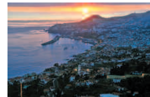
Atardecer en Funchal, capital de la isla.

La lógica se impuso a continuación, que fue dotar al vino de todos los factores que poseía en su errante perfeccionamiento, para que adquiriera aquella complejidad sin par, pero al abrigo de la comodidad y la seguridad que proporciona la tierra firme. En el siglo XVIII se comenzaron a usar métodos como el fortificado (añadir alcohol al vino para proveerle de más fuerza y aguantar los mejor viajes), e incluso hubo productores que dotaron de movimiento a los cascós (toneles) mediante ingeniosos métodos, o fuentes de calor diversas para proporcionar el clásico “estufagem”, (calentar el líquido con distintas técnicas) para acelerar considerablemente la oxidación y la evolución que lograba en aquellos viajes a las remotas indias, tanto orientales como occidentales, que hacía a ambos destinos había especialistas en traer y llevar vino.