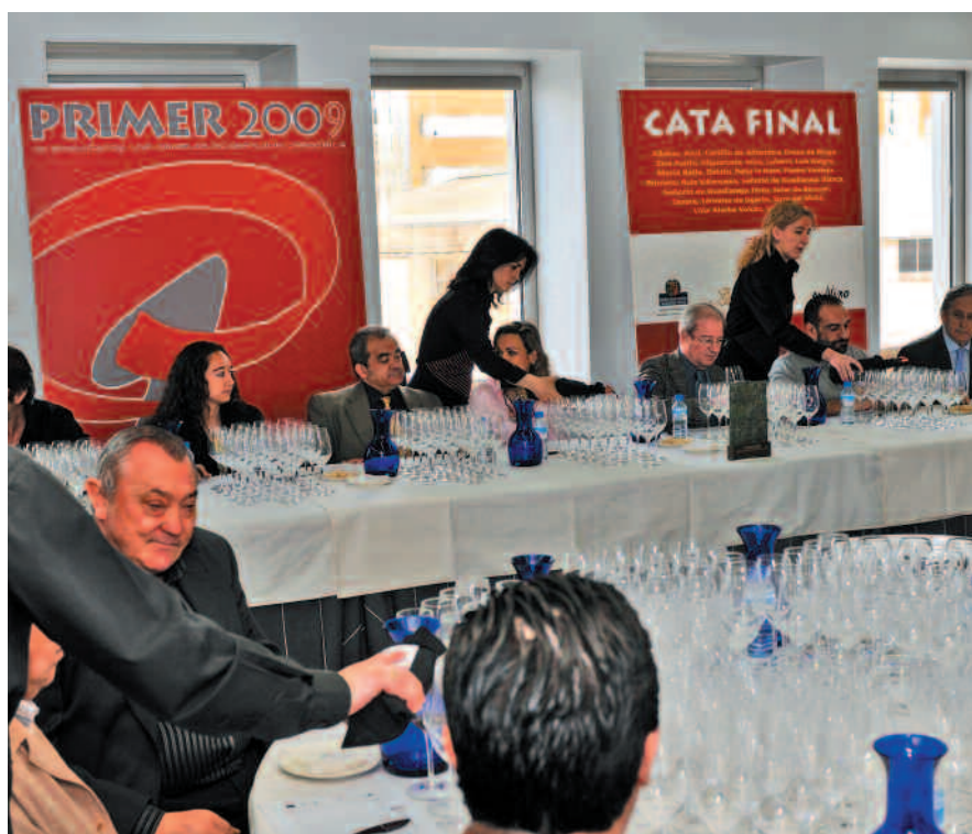
Sesión de cata final celebrada en la Sede del Consejo Regulador de la Denominación de Origen Calificada Rioja.