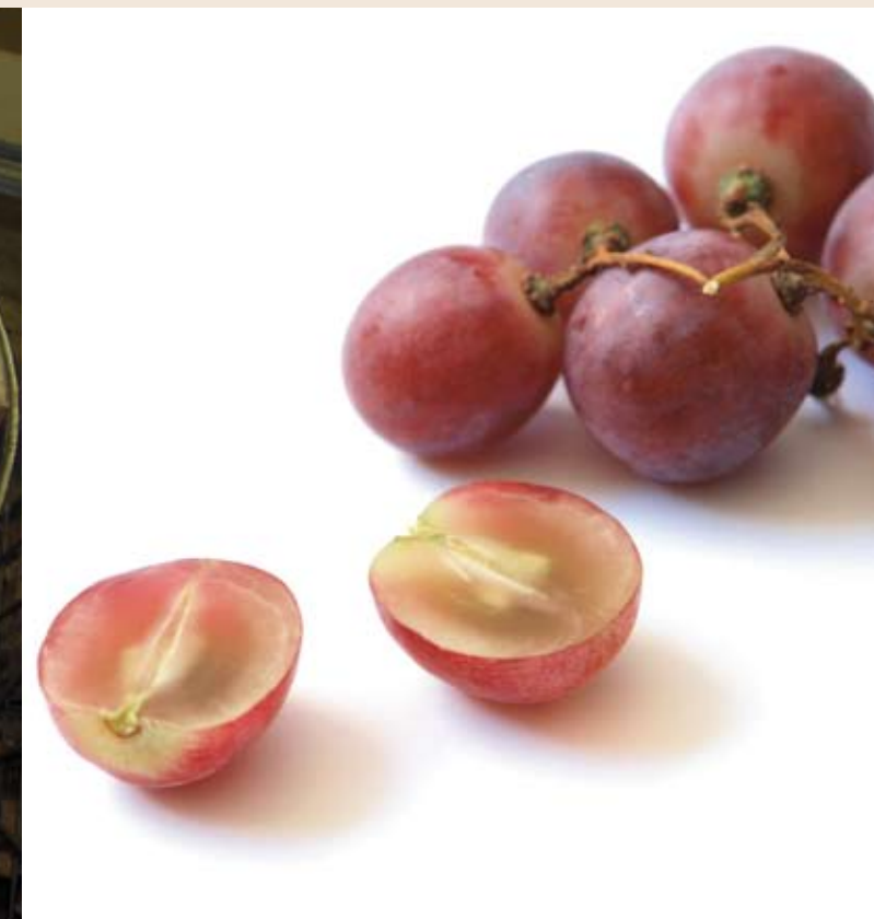
¿Cómo se controlan los taninos? Pág 47.