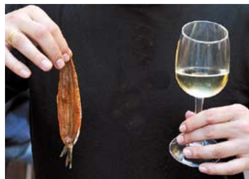
Un extracto de la vejiga natatoria del esturión hace los vinos más suaves al paladar.