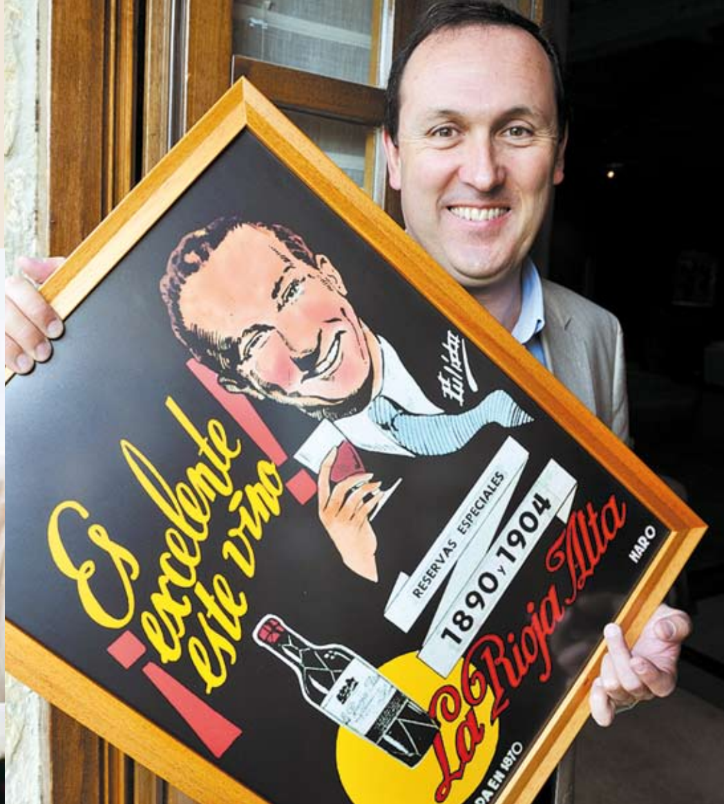
Rioja se reinventa para adaptarse a los nuevos tiempos. Pág. 14.