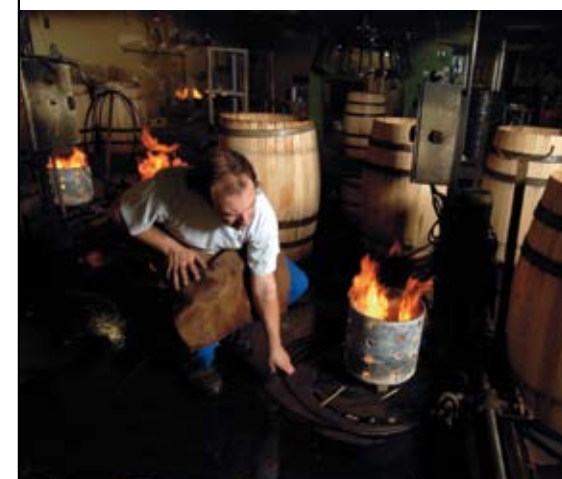
Operario de un taller de la Tonelería Nadalie, en Médoc, supervisando el brasero donde se moldean y tuestan las duelas de madera de roble. Pág. 26.