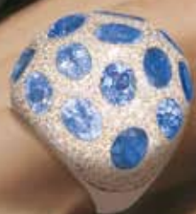
Sortija "BLUE GALAXY". PIEZA ÚNICA