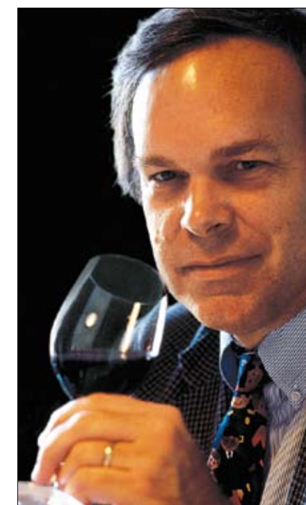
El crítico Robert Parker.

falta de sabor o aromas secos); 70-79: vino correcto (un vino promedio, con poca distinción, excepto por su buena elaboración, pero en esencia es un vino inocuo); 80-89: vino bueno o muy bueno (por encima del promedio, que posee muy buenos atributos de finura y sabor); 90-95: vino excelente (sobresaliente de complejidad y carácter excepcional, vinos fantásticos para beber en el corto plazo); y 96-100: vino extraordinario (profundo y complejo, que posee todos los atributos esperados en un vino clásico de su variedad, en los que hay que invertir). El equipo de cata de Robert Parker otorga a cualquier vino 50 puntos de partida. Tras ellos, los aspectos valorados para establecer la anterior esca-