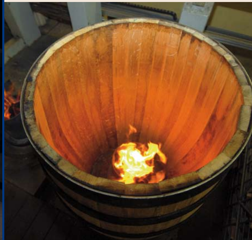
Madera y vino. Condenados a entenderse. Pág 26.