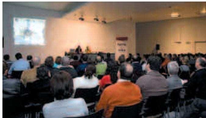
El encuentro reunió a especialistas del mundo del vino: periodistas, directores comerciales, enólogos, expertos en marketing y consultoría de empresas, distribuidores y restauradores de las islas.