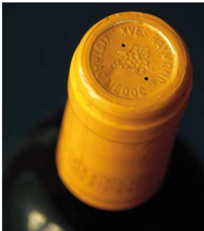
Los agujeros en la cápsula se realizan principalmente por motivos técnicos.

¿Cuál es la finalidad de rematar el cierre de las botellas con una cápsula de plomo? ¿Por qué algunas botellas los tienen y otros no? ¿Y en qué casos no sirve para nada? En los vinos con cápsula, he observado pequeñas perforaciones en el plomo. ¿Para qué sirven estos agujeros?